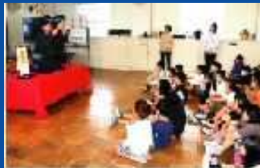
図書ボランティア/読書まつり