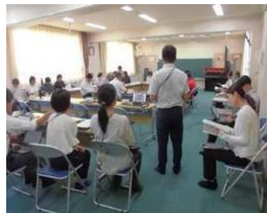
教職員全員参加の学校運営協議会

2部では、各委員・学校支援コーディネーター・4つの専門部のリーダーが参加をして、多様性を認め合える安心感のある学級・学年・学校づくりに必要な支援について、熟議が開かれました。