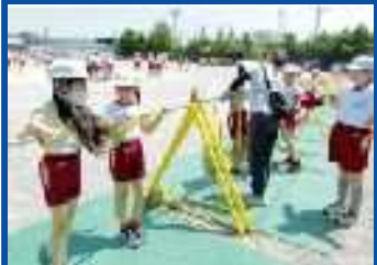
あいスポ補助/ハロスポ

QRコードを読み取っていただくと、 相生小学校HPにアクセスできます。 そこからボランティア活動の様子を ご覧いただくことができます。